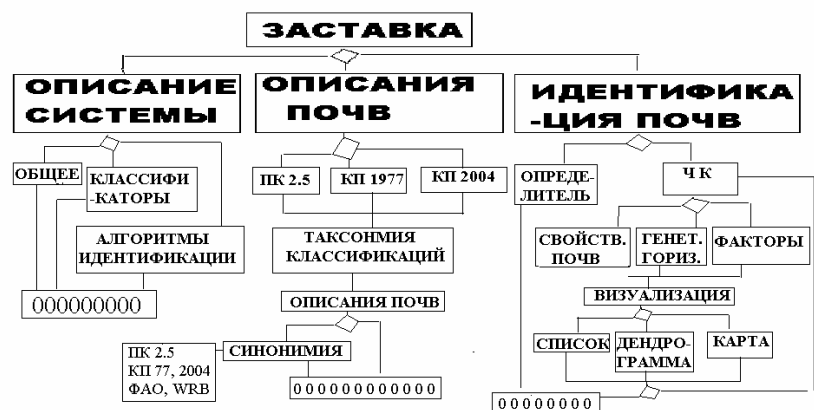
Рис. 3. Структурно-функциональная схема информационной системы классификации почв (нулями обозначены концовки блоков).

Структурно-функциональная схема будущей системы представлена на следующей блок-схеме (рис. 3).